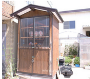
写真 2 2002年 写真 3 2010年 2.3 共にブログより引用