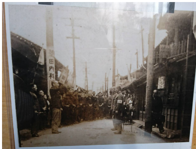
写真 1 屋根神の下で出征兵士を見送る人々