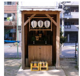
写真 4(左) 5(右) 2004年撮影 共にブログより引用